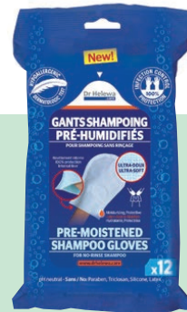
Washandje voor het haar: 12 stuks: bestelnummer: ICSHAMP12