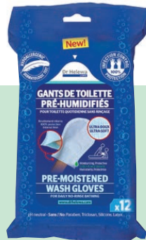
Washandje voor het lichaam: 12 stuks: bestelnummer: ICBATH12